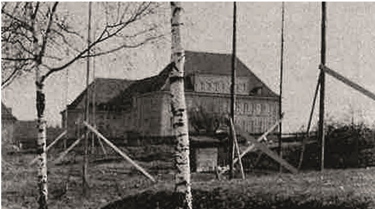
Kurz vor Beginn der Bauarbeiten im Jahre 1945