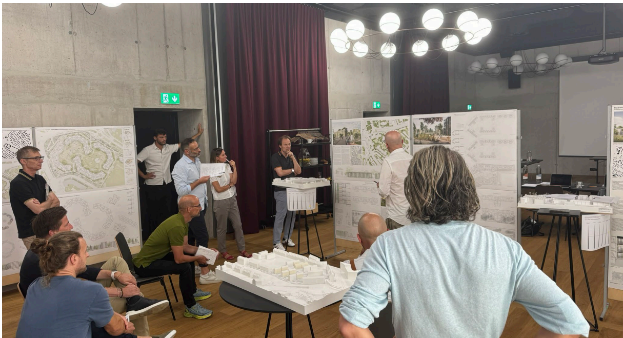
Die Jury an der Arbeit – die Qual der Wahl, bei den vielen hochstehenden Beiträgen

Es wurde ein zweistufiges Verfahren inkl. Zwischenbesprechung als Rahmen für den Studienauftrag gewählt. Im Februar 2024 fand der erste Jurytag mit den Fachjuroren statt. Dabei wurde das Projektpflichtenheft verabschiedet und in einem Präqualifikationsverfahren wurden sieben Teams aus Architektur und Landschaftsarchitektur für den Studienauftrag zugelassen. Diese wurden an einer Startveranstaltung im März 2024 gemeinsam durch Vertreter der BGL, GBRZ und der Planpartner AG begrüsst. Die Abgabe der Arbeiten für die Zwischenbesprechungen erfolgte Ende Mai 2024 und die Schlussabgabe der Teams Mitte August 2024.