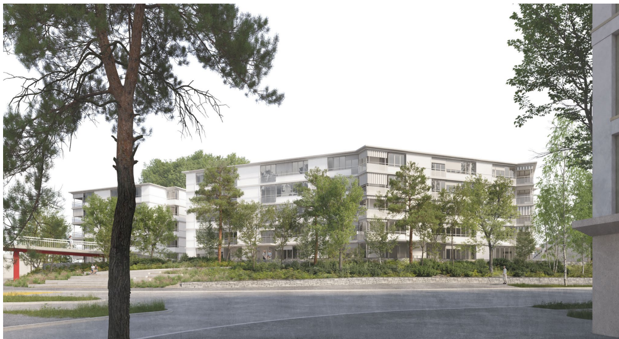
Visualisierung Strassenbild Bucheggplatz