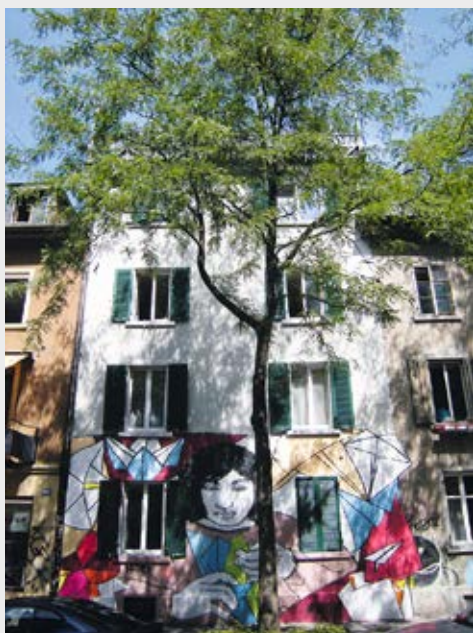
Bau- und Wohngenossenschaft Durchbruch, Zürich

In den Siebzigerjahren entwickelte sich die Wirtschaft in einer nicht mehr gesunden Weise: Die Teuerung betrug in der ersten Hälfte des Jahrzehnts regelmässig über sechs Prozent und auch die Hypothekarzinsen stiegen auf sechs Prozent. Diese Entwicklung wurde in der Folge der Erdölkrise von 1973 abrupt beendet: Die Wirtschaft brach ein und bis 1976 sanken die Bauinvestitionen um ein Drittel.