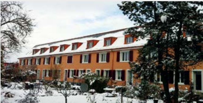
Wohnbaugenossenschaft Im Langen Loh, Basel

In jüngster Zeit stimmte der Verband seine verschiedenen Finanzierungsinstrumente noch besser aufeinander ab. Die bisher ungeschriebene Regel, dass ein Bauträger pro Projekt nur aus einem der beiden Fonds Geld beziehen darf, gilt nicht mehr. Förderungswürdige Projekte können so mit höheren Beträgen noch wirkungsvoller unterstützt werden.