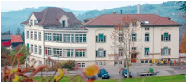
Genossenschaft Palais Bleu, Trogen

Stadtrat Eusebius Spescha, Zug, anlässlich der Feier zur Einzahlung der zehnten Spendenmillion, 1997