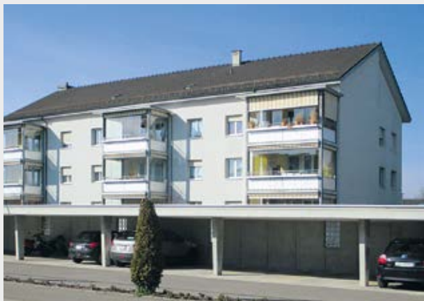
Wohnbaugenossenschaft Obersee, Jona

der. Diese wurden schnell mehr: Wurden 1969 132 000 Franken einbezahlt, waren es 1981 bereits 268 000 Franken und 1982 wurde erstmals die 300 000-Franken-Grenze geknackt. Das Vermögen des Fonds wuchs kontinuierlich und stieg, begünstigt auch durch die hohen Zinsen, bereits 1975 auf über zwei Millionen Franken.